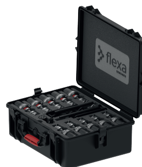
SC 26K + REPEATER + GATEWAY + MAGNETIC KEY & CABLES + 10x 3,25t SHACKLE LOAD CELL = Total Weight: 16,7 Kg - 36,81 Lbs