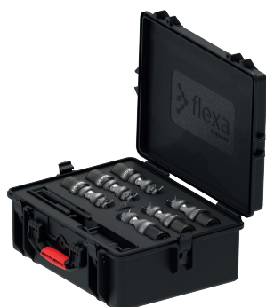
SC 26K + REPEATER + GATEWAY + MAGNETIC KEY & CABLES + 6x 4,75t SHACKLE LOAD CELL = Total Weight: 14,7 Kg - 32,40 Lbs