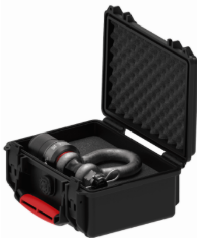
SC 21 + 3,25t SHACKLE LOAD CELL